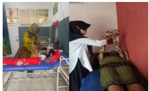
Gambar 1. Dokumentasi Tahapan Pelaksanaan Rebozzo

Diagram 2 menunjukkan jumlah pengetahuan ibu setelah dilakukan edukasi meningkat menjadi baik sebanyak 57%. Ini membuktikan bahwa kegiatan edukasi dan penjelasan Langkah dan tata cara melakukan rebozzo dapat dipahami oleh ibu hamil dalam persiapan persalinannya.