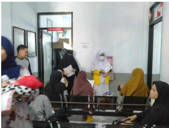
Gambar 1. Dokumentasi Pengarahan