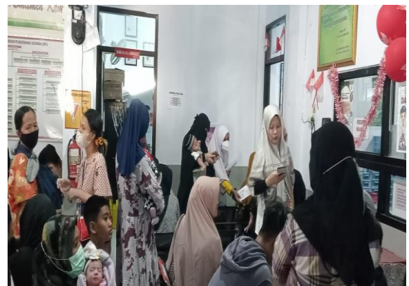
Gambar 3. Dokumentasi Pelaksanaan Health Promotion Model.