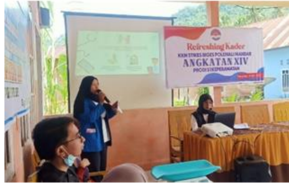
Gambar 3 Pemberian penyuluhan kegiatan utama posyandu

dengan pemberian penyuluhan terkait kegiatan utama posyandu.