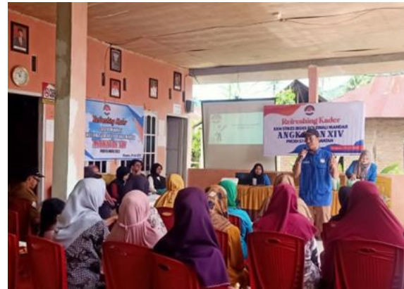
Gambar 6 Pemberian penyuluhan pengukuran dan penimbangan bayi

Kemudian dilakukan sesi diskusi terkait pengukuran dan penimbangan bayi. Beberapa peserta cukup antusias selama kegiatan penyuluhan ini dilaksanakan. Setelah serangkaian kegiatan kemudian dilanjutkan post test .