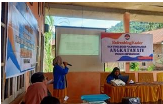
Gambar 5 Pemberian penyuluhan kunjungan rumah dan saran untuk kader

Setelah diberikan penyuluhan terkait kunjungan rumah dan saran untuk kader, dilanjutkan dengan pemberian penyuluhan terkait pengukuran dan penimbangan bayi.