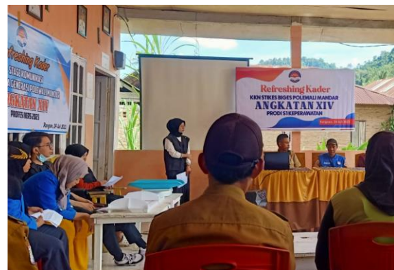
Gambar 4 Pemberian penyuluhan pelaksanaan 5 langkah di hari H posyandu

Pengetahuan kader posyandu mengalami peningkatan sesudah diberikan penyuluhan terkait pelaksanaan 5 langkah posyandu..