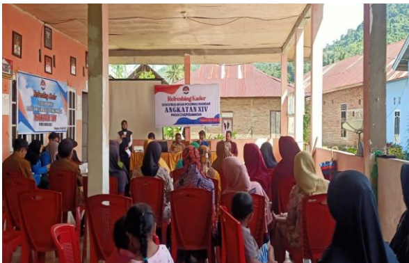
Gambar 2 Pemberian penyuluhan tugas-tugas kader posyandu

Setelah diberikan penyuluhan, kader posyandu mulai memahami tentang tugas-tugas kader posyandu. Setelah diberikan penyuluhan terkait tugas-tugas kader posyandu, dilanjutkan