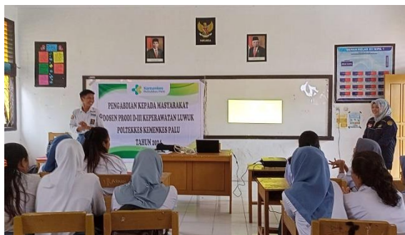
Gambar 2 Promosi Kesehatan siswa SMA