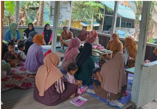
Gambar 1. Penyuluhan dan Praktik

Kegiatan pengabdian kepada masyarakat berupa pelatihan stimulasi pijat endorphin, oksitosin, dan sugestif telah dilaksanakan di Desa Kale Bentang dengan melibatkan kader kesehatan sebagai sasaran utama kegiatan. Seluruh rangkaian kegiatan, mulai dari penyuluhan, demonstrasi, hingga praktik langsung, berjalan dengan lancar dan mendapatkan partisipasi aktif dari kader kesehatan. Kegiatan diawali dengan pengukuran tingkat pengetahuan awal melalui pre-test, kemudian dilanjutkan dengan pemberian materi dan praktik terapi komplementer.